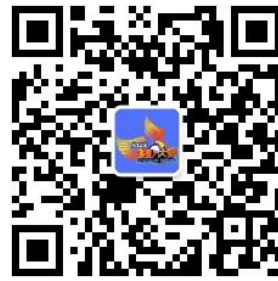
全国 3D 大赛微信公众号

全国三维数字化创新设计大赛组委会 国家制造业信息化培训中心 全国 3D 技术推广服务与教育培训联盟(3D 动力) 光华设计发展基金会 2023 年 10 月